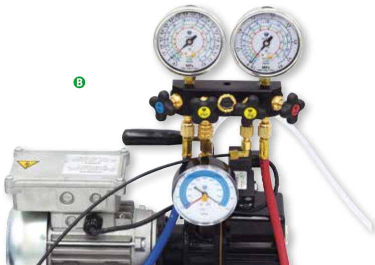
Particolare del kit dotato di elettrovalvola e vacuometro