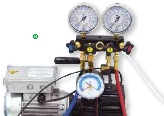
Detail of the kit with solenoid valve and vacuum meter