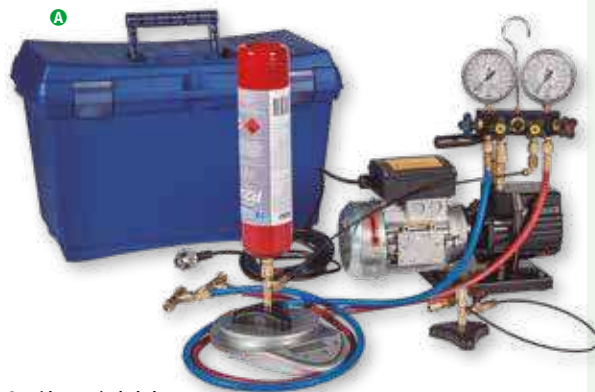
Cartridge not included