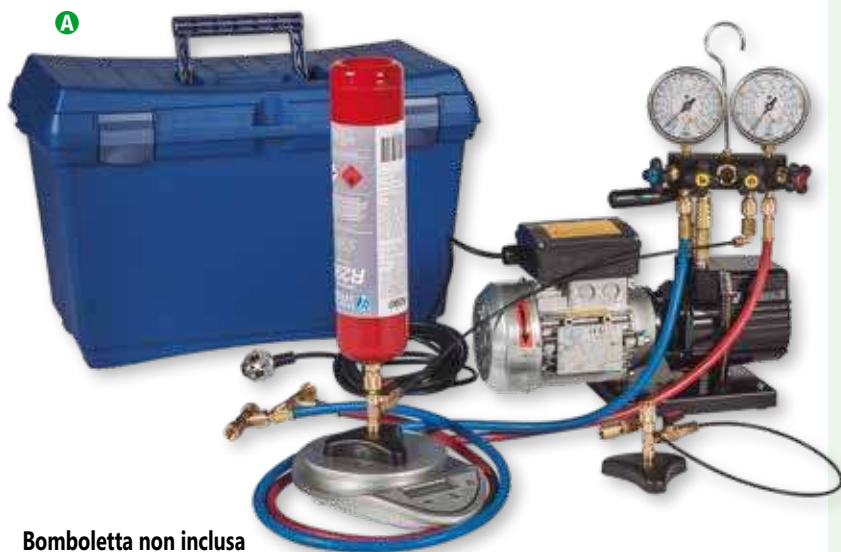
Bomboletta non inclusa