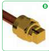
B Tighten the nut until the signal.