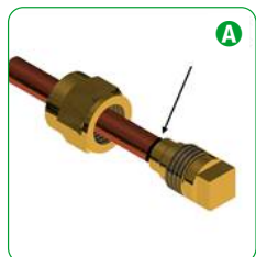
A Inserire il tubo nel sistema EASY CAP.