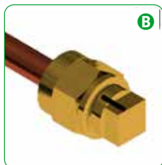
B Serrare il dado fino al segnale.