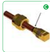
C Loosen to check the quality of the work obtained.