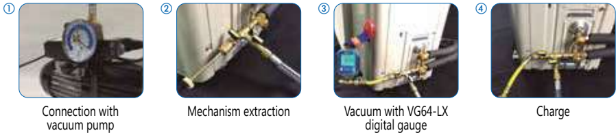
1 Connection with vacuum pump