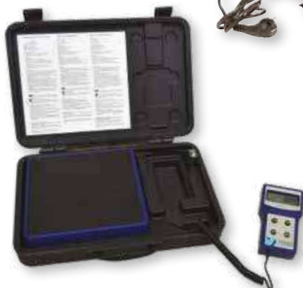
CADDY FOX 100 SCALE