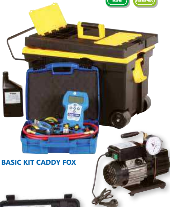
BASIC KIT CADDY FOX