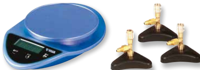
BILANCIA PER CADDY FOX 5