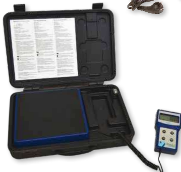
BILANCIA PER CADDY FOX 100