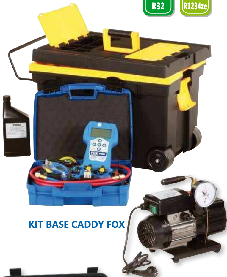
KIT BASE CADDY FOX