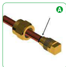
A Inserire il tubo nel sistema EASY CAP.