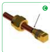
C Loosen to check the quality of the work obtained.