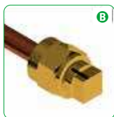
B Tighten the nut until the signal.