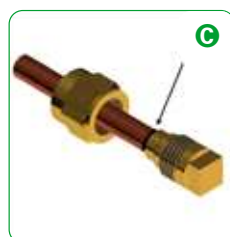
C Allentare per verificare la qualità del lavoro ottenuto.