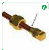
A Insert the tube into the EASY CAP system.