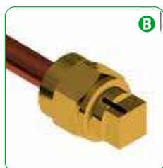
B Serrare il dado fino al segnale.